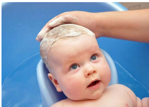
Fig. 5 Shampoing d'un nouveau-né

Les enfants en bas âge sont pleins de plis qui sont autant de nids à microbes. Il faut bien insister au niveau des plis lors du savonnage comme du rinçage et de l'essuyage.