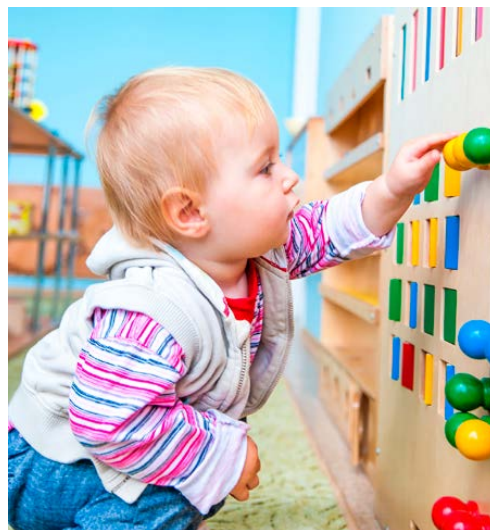
Fig.4 Enfant de moins de 3 ans à l'école

Le projet pédagogique d'un enseignant, et notamment le projet de classe, est appliqué par celui-ci tout au long de l'année scolaire. Les ATSEM apportent leurs compétences éducatives et techniques à la mise en œuvre du projet de l'enseignant.