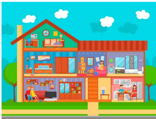
Fig. 8 Une maison avec ses espaces de vie

L'accueil au domicile fait que l'enfant évolue au sein d'espaces de vie avant tout dédiés à la famille. Ces espaces doivent donc être aménagés pour répondre à la fois aux besoins des enfants accueillis et de la famille qui y réside.