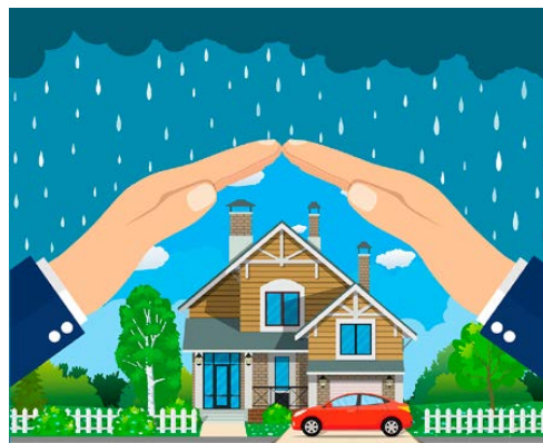
Fig. 14 La sécurité et l'hygiène dans la maison

La sécurité et l'hygiène sont deux composantes essentielles qui permettent le bon développement de l'enfant. Pour assurer la sécurité du professionnel et de l'enfant, un aménagement adapté et des équipements homologués sont indispensables. En ce qui concerne l'hygiène, un lieu salubre, bien entretenu et confortable est primordial pour le bien-être des occupants, adultes comme enfants.