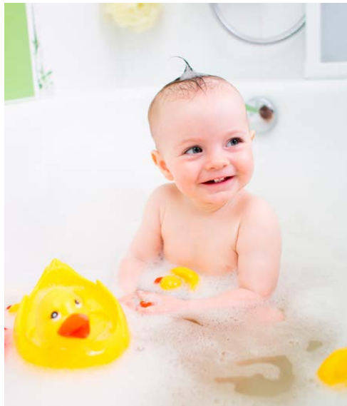
Fig. 3 Bébé dans son bain © Oksana Kuzmina - Fotolia

Le bain est un moment nécessaire pour l'hygiène corporelle du bébé et de l'enfant. Laver l'enfant a pour objectif de :