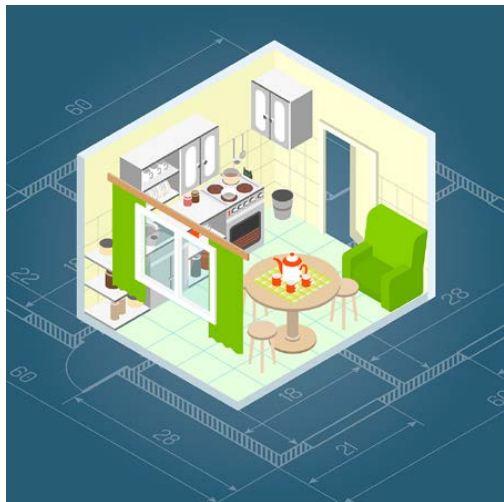
Fig. 10 La cuisine

Cet espace, ouvert ou fermé, peut être accessible à l'enfant, ou non, selon l'aménagement réalisé au niveau de la sécurité mais aussi selon le projet éducatif du professionnel et des parents.