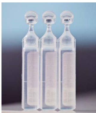
Fig. 2 Sérum physiologique

Le sérum physiologique est régulièrement utilisé : – pour le soin des yeux, sur une compresse ; – pour le soin du nez, sur des fusettes ou directement dans le nez dans le cas de la désobstruction rhino-pharyngée (DRP).