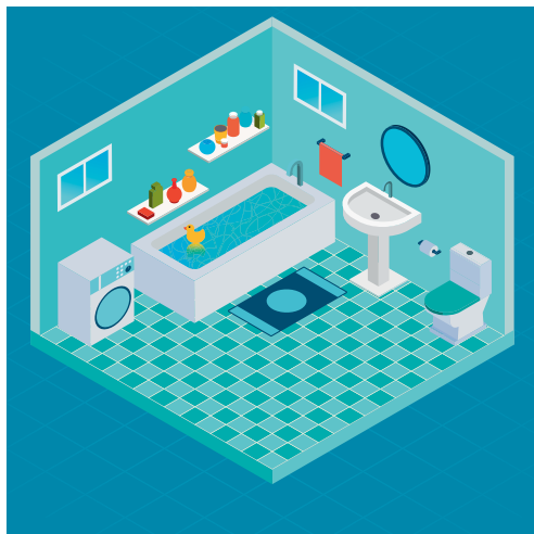
Fig. 12 La salle de bain

Cet espace peut être, selon les modalités du contrat de travail et d'accueil, le lieu pour effectuer le change de l'enfant mais aussi celui de la toilette (bain, douche, brossage des dents, etc.).