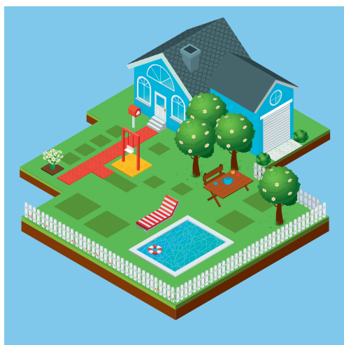
Fig. 13 Les extérieurs

Ces lieux sont très appréciés par les professionnels et les parents car ils évitent une sortie systématique à l'extérieur du domicile pour se rendre dans des parcs, squares ou autres lieux de jeux extérieurs.