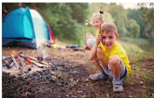
Fig.3 Enfants en classe découverte