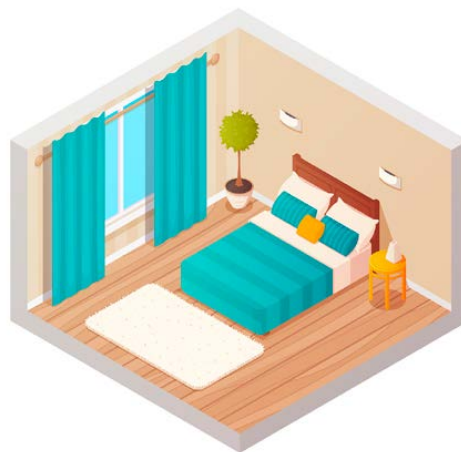
Fig. 11 La chambre

Cet espace est très important car il permet de répondre à un des besoins physiologiques fondamentaux de l'enfant : dormir et se reposer.